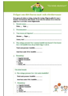
Frågor: Mat och föräldraskap